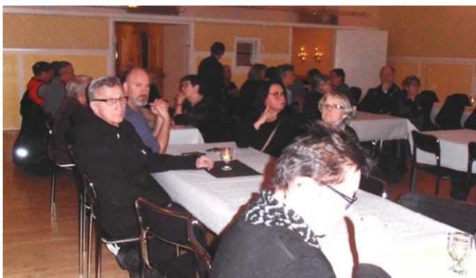
Publiken i väntan på att showen ska börja

PS. Ursäkta den dåliga kvaliteten på bilderna men jag är en usel fotograf. DS