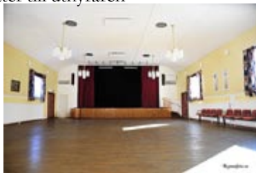
Stor sal med scen och ljudanläggning