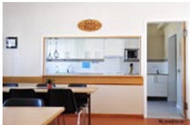
Fullt utrustat kök/Café