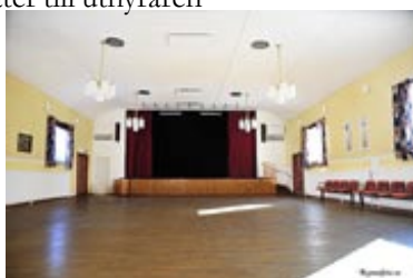
Stor sal med scen och ljudanläggning