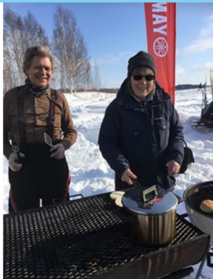
Här vankas hamburgare