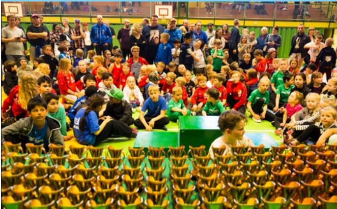
Guldpokaler bägrar för förväntansfulla brottare

Under flera veckor har planeringen med cupen pågått. Skicka inbjudan, boka domare och sekretariat, beställa pokaler, baka, gör scheman inför hur dagen ska se ut mm. På torsdagskvällen hade alla anmälningar kommit in, vi insåg då att vår "lilla" tävling hade blivit en "stor" tävling. Förra året hade vi 86 anmälda brottare, detta år var det 145 som anmält sig. Det blev tillslut 130 tävlingssugna brottare som tävlade under dagen.