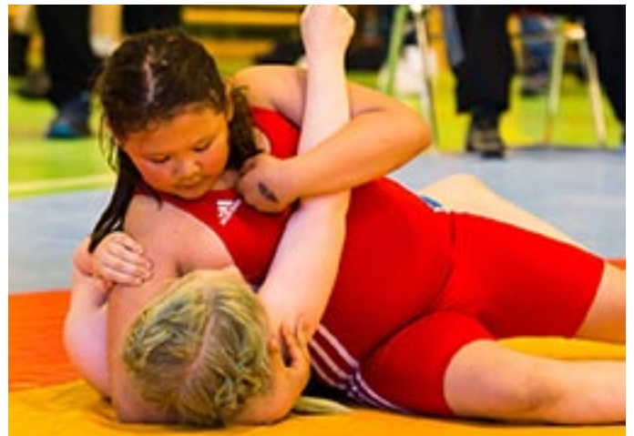
Hon har greppet

Invägningen hade gjorts på vardera klubb under veckan. Samtliga brottare klarade hälsokontrollen med bravur, efter detta hade sekretariatet ett gediget arbete med att skriva tävlingslistor till samtliga grupper. Dessa grupper sammanställs efter erfarenhet, vikt och ålder för både flickor och pojkar. Totalt blev det 35 viktklasser från 18 kilo upp till 71 kilo. Helgecupen är en cup som främst riktar sig till nybörjare, de som går sina allra första brottningsmatcher. Vi är mycket glada åt att det var hela 74 brottare som startade sin brottarkarriär i Rosvik.