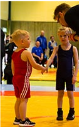
Först hälsning - sedan match

På lördagsmorgonen vaknade flera brottare och föräldrar tidigt med pirr i magen. Alla brottare, ledare och föräldrar möttes upp i sporthallen klockan 9, sedan var dagen i gång. Kaffe kokades, fika ställdes fram, tävlingslistor skrevs ut mm. Klockan 10 hade samtliga 9 klubbar samlats från Kiruna i norr till Umeå i söder. Det var då dags för hälsokontroll då naglar kontrolleras (måste vara kortklippta) och symtom på ringorm kollas.