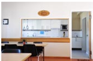
Fullt utrustat kök/Café