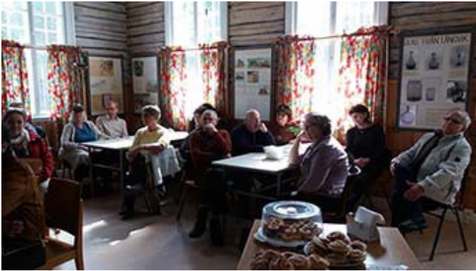
Intresserade åhörare i Långviks byabus.

Pitebygdens Forskarföreningen har bestämt att ha fler aktiviteter för medlemmar, och en av de första blev en utflykt till Långvik. En solig vårdag i maj fick Långviks Byahusförening därför storfrämmande.