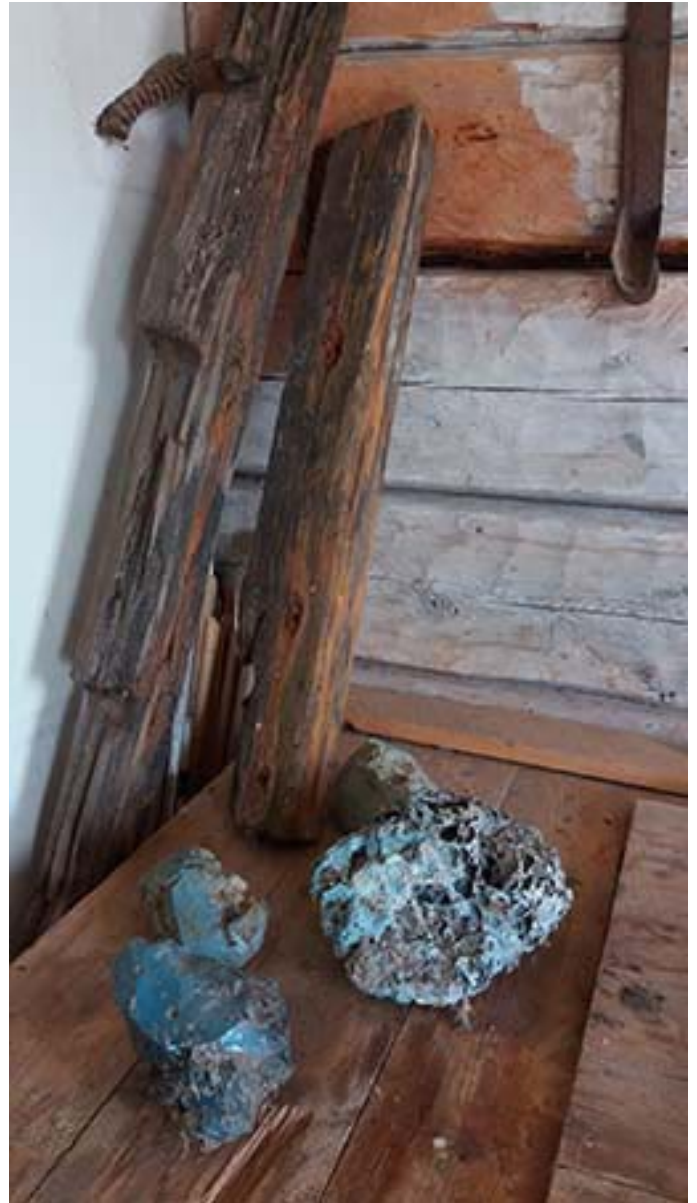
"Slagg från Långviks Glasbruk".

En del av besökarna gick även kulturstigen, som visar på de platser där det tidigare låg olika byggnader, t ex degelkammare, torp för glasblåsare, arbetarbostad och