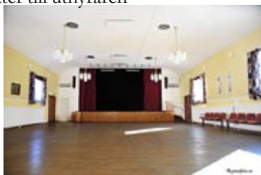
Stor sal med scen och ljudanläggning