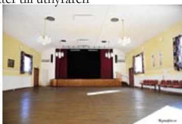
Stor sal med scen och ljudanläggning