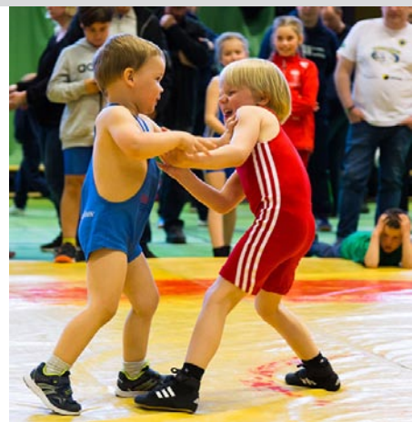
Det ska börjas i tid.....

Alla utövare, ledare och föräldrar vill passa på och tacka alla som kom och hejade under dagen!