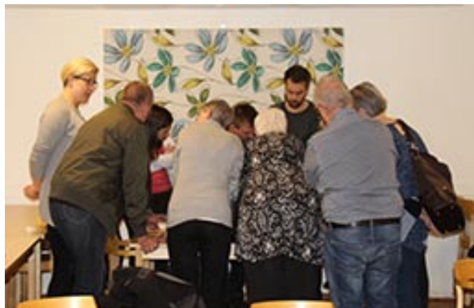
Förslag om vad och var man ska bygga i Rosvik