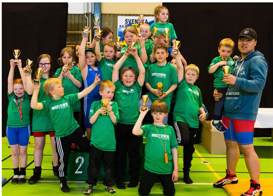
Glada brottare från Rosvik

Vi välkomnar flera nyfikna och blivande brottare till uppstart till hösten. Om det finns intresse kommer det förhoppningvis att bli en grupp för de som vill pröva på brottning för första gången och en grupp för de som redan brottats ett tag. Det finns ingen åldersindelning, alla är välkomna. För "nybörjarna" kommer det att bli mycket lek, kullerbyttor och andra enklare övningar.