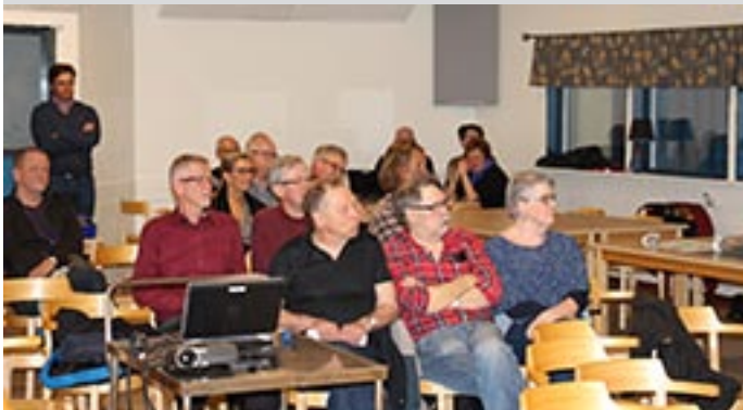
Lyssnar på tjänstemännens information om Rosvik

Mötet om den fördjupade översiktsplanen (FÖP) angående Rosvik som ett Landsbygdscentra var välbesökt.