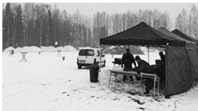
Förberedelser på gång inför firandet