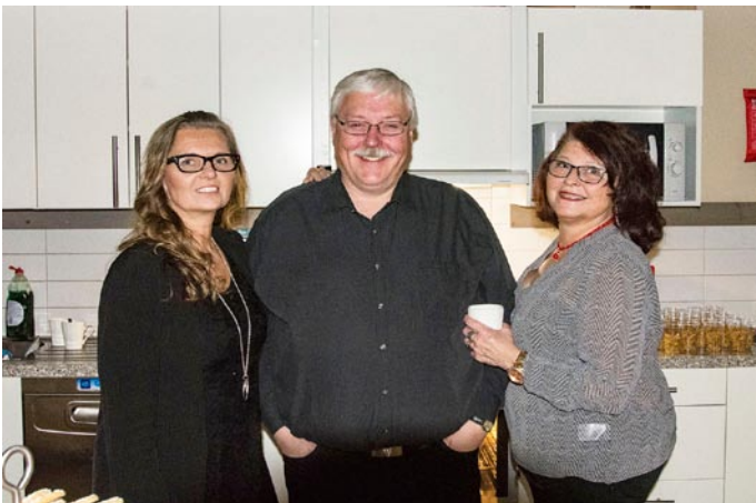
Delar av arrangörstabben.