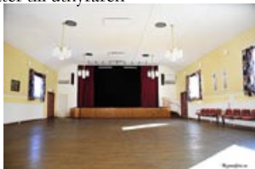
Stor sal med scen och ljudanläggning