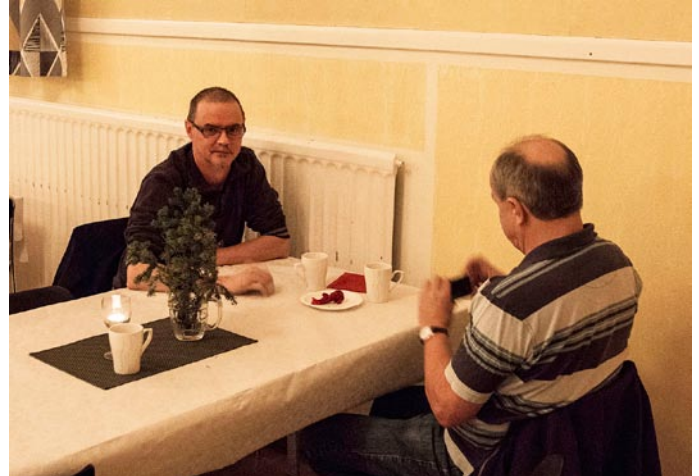
En kopp kaffe smakar bra.