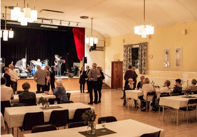
Väntar på att Rockrävarna ska spela upp till dans.